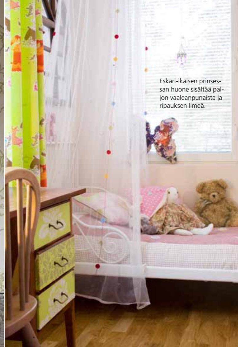
Eskari-ikäisen prinsessan huone sisältää paljon vaaleanpunaista ja ripauksen limeä.