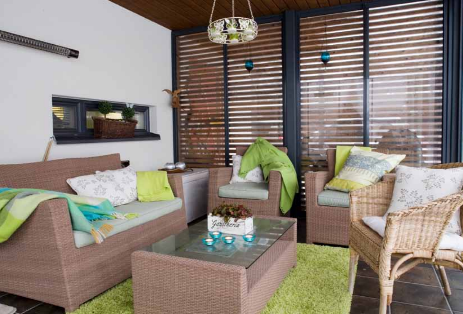
Viihtyisä terassi on kuin toinen olohuone lasisten seiniensä ja harkitun sisustuksensa ansiosta.

kennuttivat itselleen talon, tontille jäi rakennusoikeutta ja mitä mainioin tila myös toiselle omakotitalolle. Oli oiva tilaisuus päästä lähelle isovanhempia, ja lasten päiväkodit ja koulutkin löytyvät nyt lähietäisyydeltä.