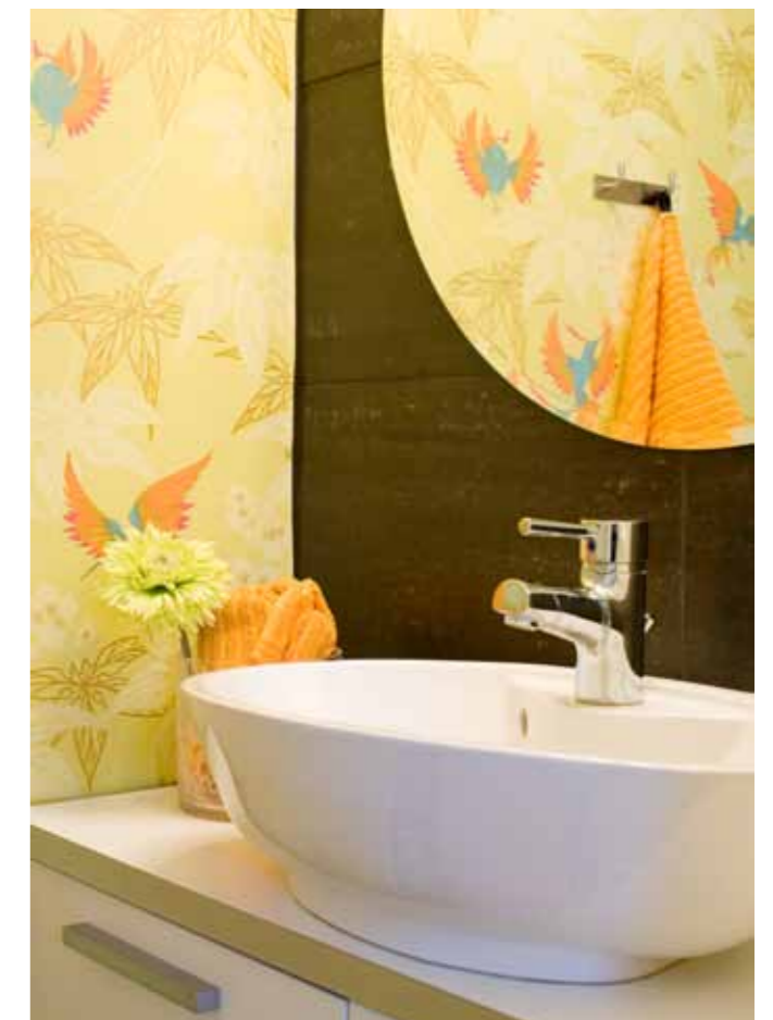
Näyttävä tumma seinä on laatoitettu Kaakelikeskuksesta hankituilla laatoilla. Valkoinen allaskaappi on Topi-Keittiöiltä ja allas Idolta.

– Olen itse kotoisin tältä asuinalueelta. Kun vanhempani ra-