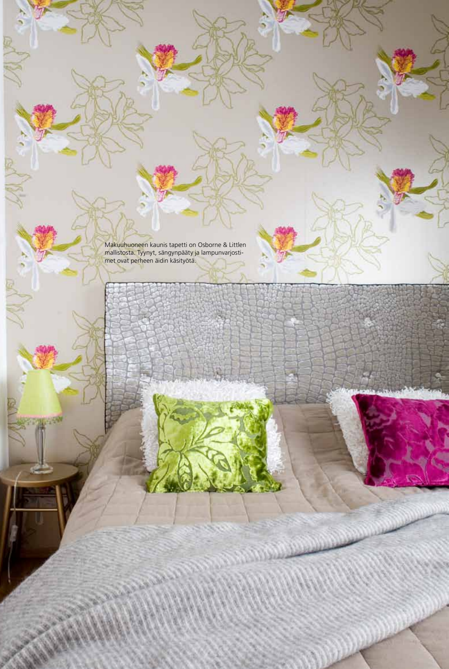
Makuuhuoneen kaunis tapetti on Osborne & Littlen mallistosta. Tyynyt, sängynpäätä ja lampunvarjostimet ovat perheen äidin käsityötä.