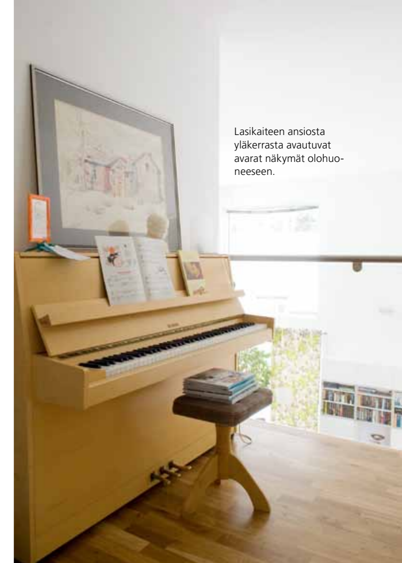
Lasikaiteen ansiosta yläkerrasta avautuvat avarat näkymät olohuoneeseen.

tilat, wc ja kodinhoitohuone. Eteisen oranssipohjainen Osborne & Littlen tapetti jatkuu alakerran pienen wc:n seinälle. Emännän lempivärejä on käytetty kaikissa kodin tiloissa.