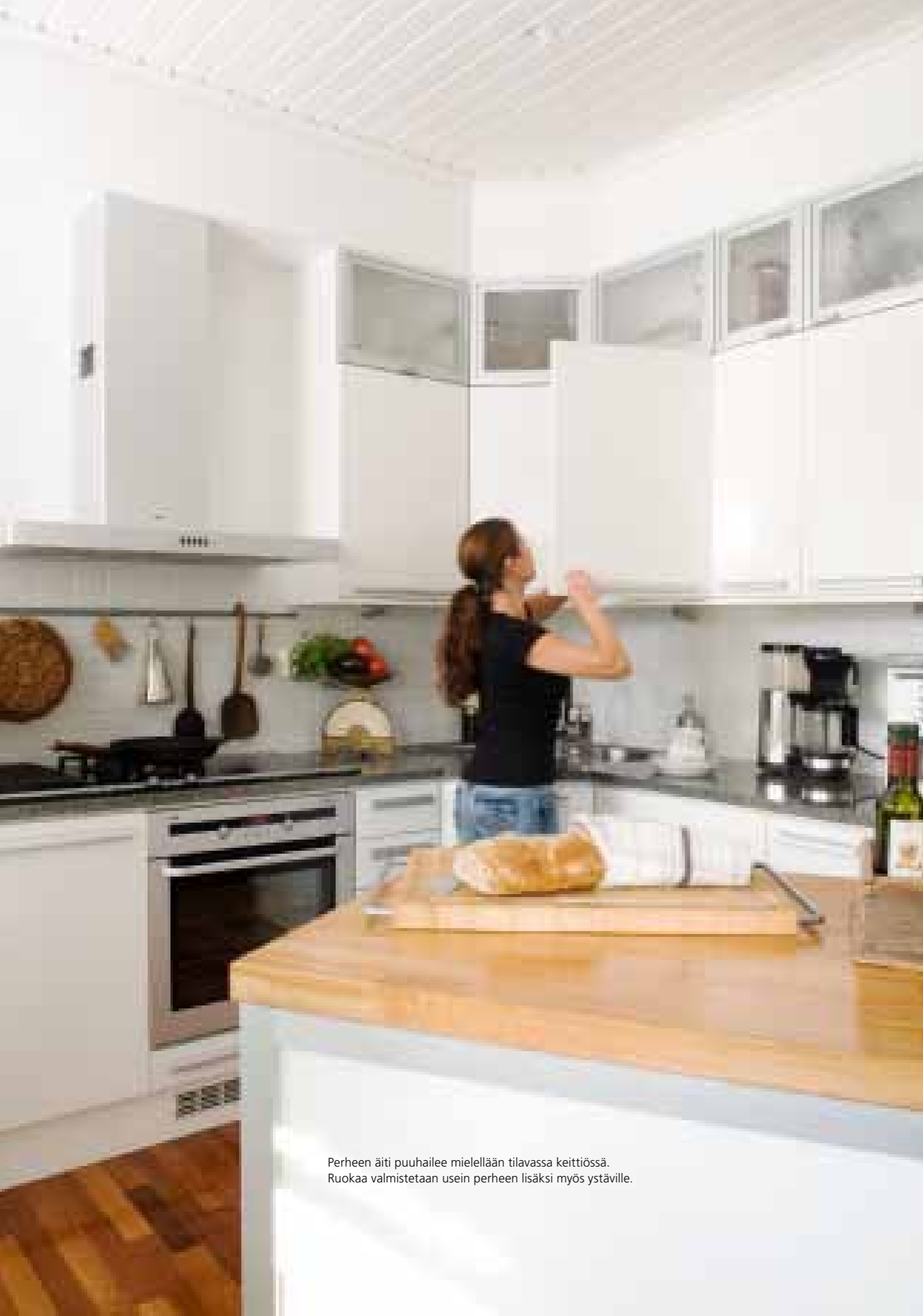
Perheen äiti puuhailee mielellään tilavassa keittiössä. Ruokaa valmistetaan usein perheen lisäksi myös ystäville.