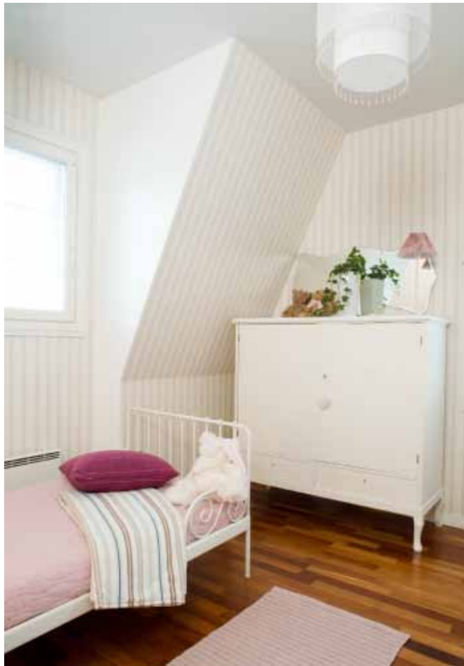
Eliaksen huoneen vaaleita värejä piristää Englannista tilatut päiväpeitto ja koristetyyny. Lämpimät puunsävyt lisäävät sisustukseen viihtyisyyttä.