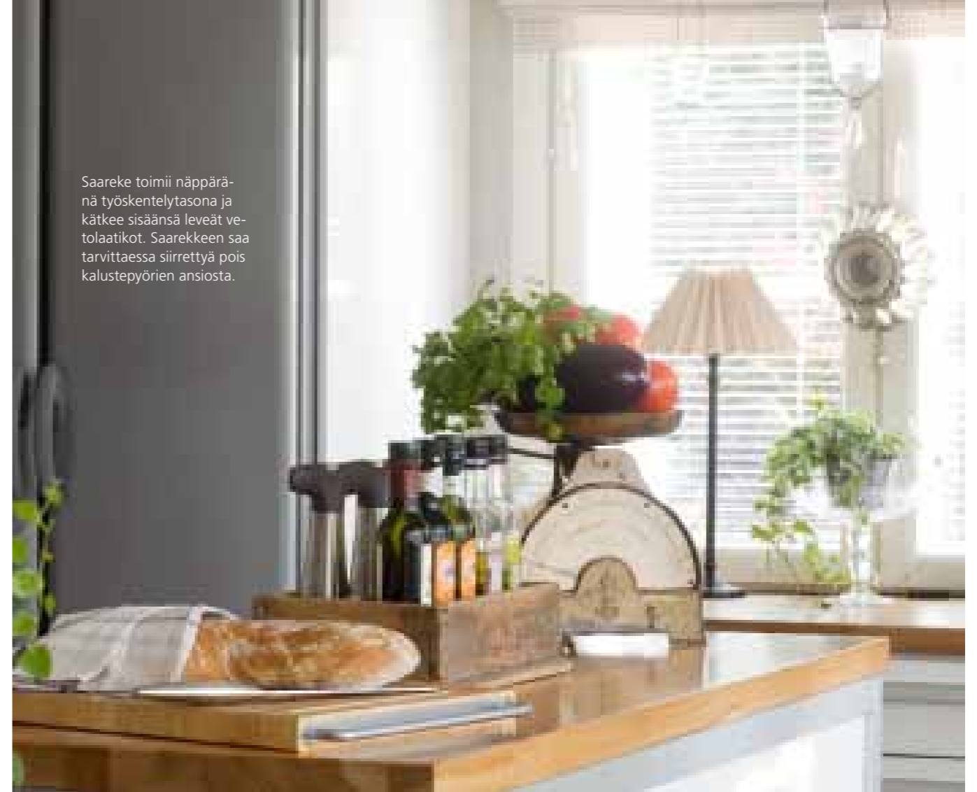
Saareke toimii näppäränä työskentelytasona ja kätkee sisäänsä leveät vetolaatit. Saarekkeen saa tarvittaessa siirrettyä pois kalustepyörien ansiosta.