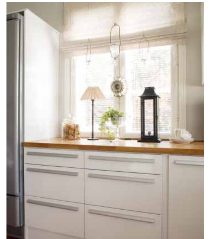
A la Carte -keittiöltä hankittujen kalusteiden toimivuus on miellyttänyt ruuanlaitosta pitävää perhettä. Laatikot ovat säilytyksen kannalta kätevämpiä kuin tavalliset hyllykaapit.

Avaran olohuoneen jatkeena on valoisa erkkeri, jossa ruo-