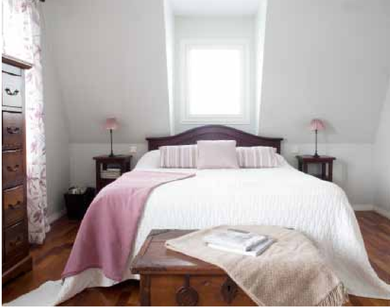
Makuuhuoneessa tumma puu ja vaaleat tekstiilit luovat rauhallisen tunnelman. Katon kaunis muoto korostuu mansardikattoisen talon yläkerrassa.