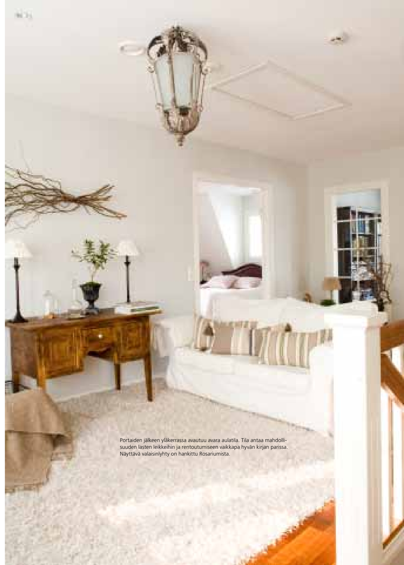
Portaiden jälkeen yläkerrassa avautuu avara aulatila. Tila antaa mahdollisuuden lasten leikkeihin ja rentoutumiseen vaikkapa hyvän kirjan parissa. Näyttävä valaisinlyhty on hankittu Rosariumista.